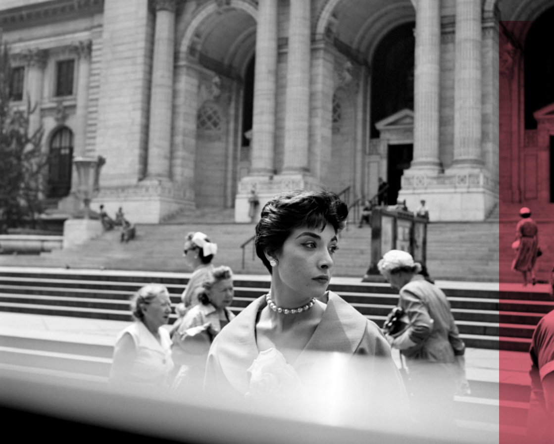
Vivian Maier courtesy of the Maloof Collection

และก็เรื่องราวของเขาและเธอทั้งหมด นี่เองที่ถูกรื้อฟื้นขึ้นใน Finding Vivian Maier หนังสือสารคดีที่มาลูฟประเดิมเก้าอี้ กำกับเองเป็นครั้งแรกกับ ชาร์ลี ซีสเกล คน ทำหน้าที่อิสระร่วมเมืองชิคาโก