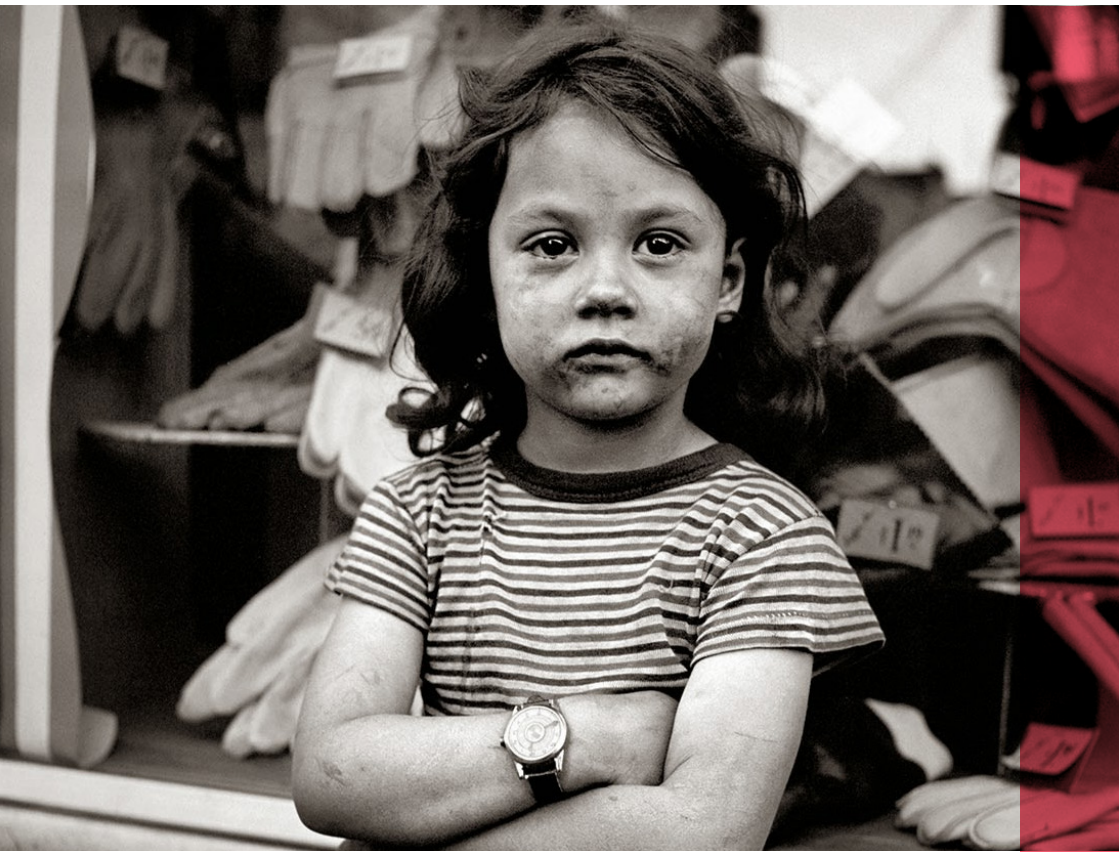
Vivian Maier courtesy of the Maloof Collection

ที่ทำให้เธอไม่ได้เผยแพร่ผลงานของเธอเสียที “อย่างไรก็ดี สำหรับผมแล้ว ความ เป็นจริงที่เหลือเชื่อกว่านั้นอีกก็คือ แม้จะ ต้องเผชิญอุปสรรค แต่วิเวียนก็ไม่เคยละทิ้ง ความเป็นศิลปิน เธอยังคงตั้งใจต่อสิ่งที่รัก และต่อตัวเองไม่เปลี่ยนแปลง และแม้จะไม่ สามารถเผยแพร่ผลงานได้ เธอก็เก็บรักษามัน ไว้อย่างดีเป็นจำนวนมหาศาล เพราะ เธอรู้ว่ามันเป็นงานที่ดีและมีค่าควรแก่การ ได้ปรากฏต่อสายตาโลกในสักวันหนึ่ง “ผมคิดว่าเรื่องราวของเธอทำให้เรา